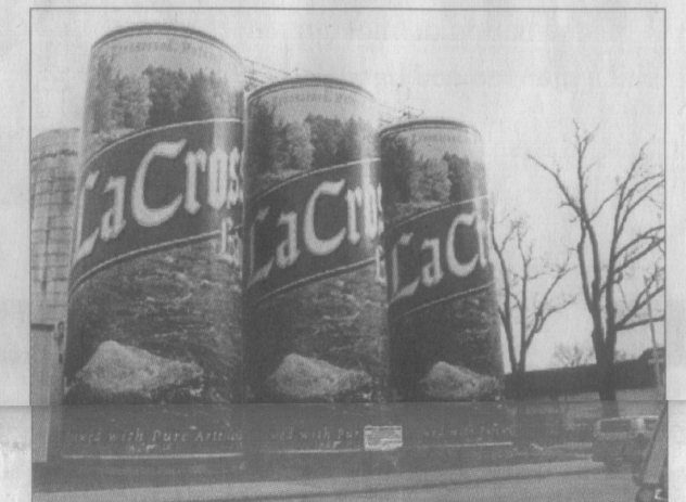
ØLTØRST? Verdens største six-pack er en del av City-bryggeriet i LaCrosse, Wisconsin. De seks tankene ble konstruert i 1969 og inneholder 82 millioner liter øl – det er nok til å gi deg en six-pack hver dag i 3351 år!