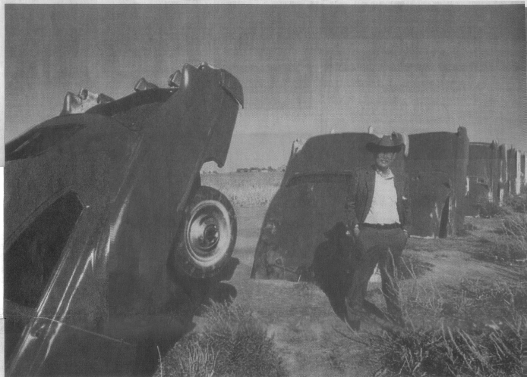
CADILLAC RANCH: Mr. Stanley 3. har en verdenskjent hveteåker. I 1974 kjørte han ti Cadillac ned i ti hull i åkeren sin. Kan det betraktes som kunst? De kan i hvert fall ses fra Route 66 i Amarillo, Texas.

Verdens største... – http://www.worldlargestthings.com/ – Spiselige musling – http://www.worldlargestthings.com/california/clam.htm – Amerikanske flagg – http://www.superflag.com – Sjakkbrett – http://www.worldlargestthings.com/california/chess-set.htm – Ketchupflaske – http://www.catsupbottle.com/ – Sko – http://www.worldlargestthings.com/california/shoe.htm