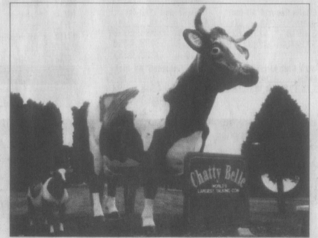
SNAKKENDE KU: Verdens største snakkende ku, Chatty Belle, er 4,8 meter høy og 6 meter lang. Hun står i Neilsville, Wisconsin, men er ikke like populære som verdens største ku, Salem Sue i North Dakota.